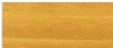
モクシヨク ケヤキ